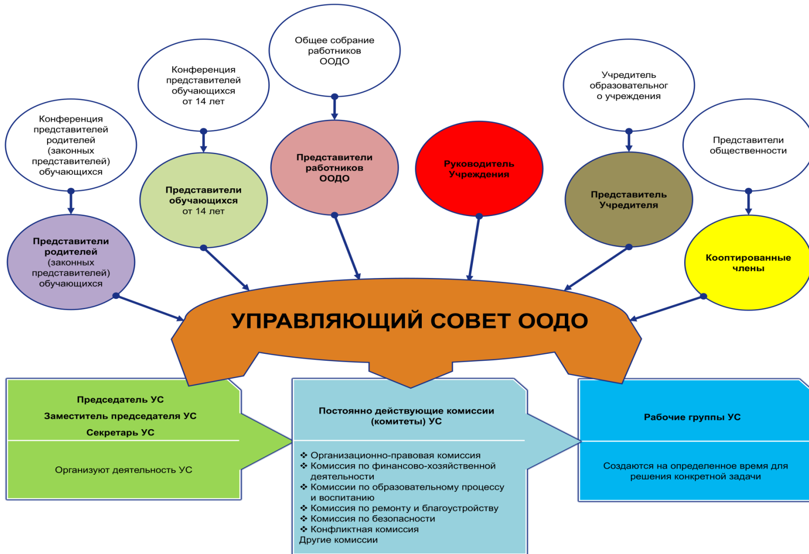
Рис. 2. Модель № 2 – «Структура управляющего совета в образовательной организации дополнительного образования» (УС ООДО)