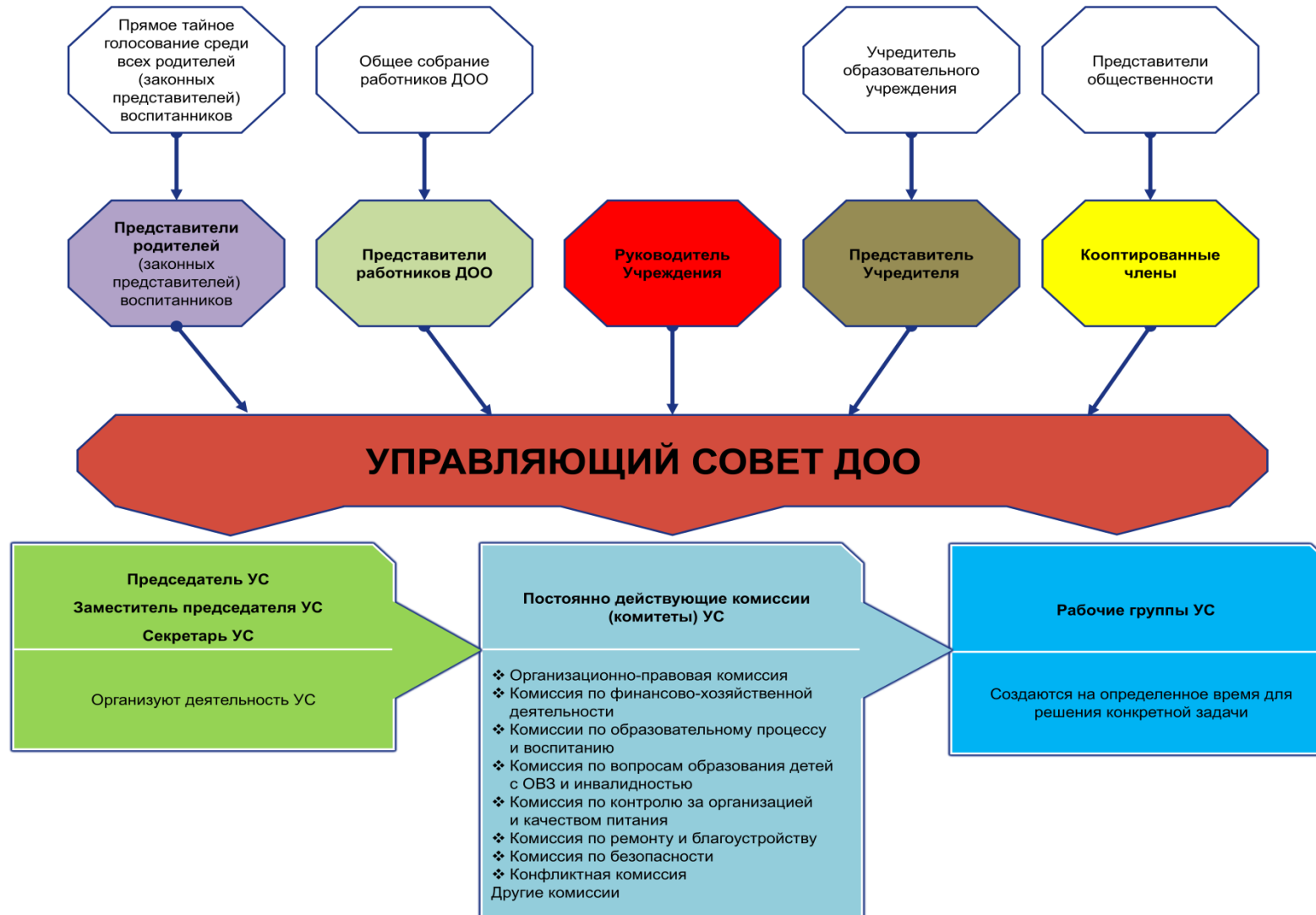
Рис. 3. Модель № 3 – «Структура управляющего совета в дошкольной образовательной организации» (УС ДОО)